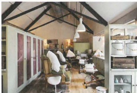
Im SOHO FARMHOUSE in Oxfordshire werden die „Neville Treatments“ angeboten: Gesichtspflege und Massagen extra für ihn. DZ ab 400 Euro