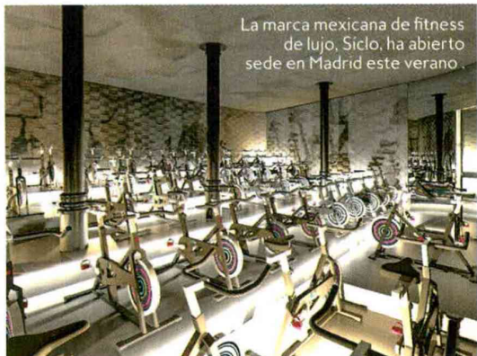
La marca mexicana de fitness de lujo, Sículo, ha abierto sede en Madrid este verano.

Los ejercicios aeróbicos incrementan la circulación de la sangre, lo que ayuda a nutrir, regenerar y eliminar las toxinas de la piel. En el recién inaugurado estudio Sículo Madrid realizan sesiones indoor de 45 minutos en donde podrás disfrutar de la mejor mezcla de música en una sala oscura, con luces de discoteca, mientras pedaleas subida a una bicicleta estática (25 €/sesión; siclo.com).