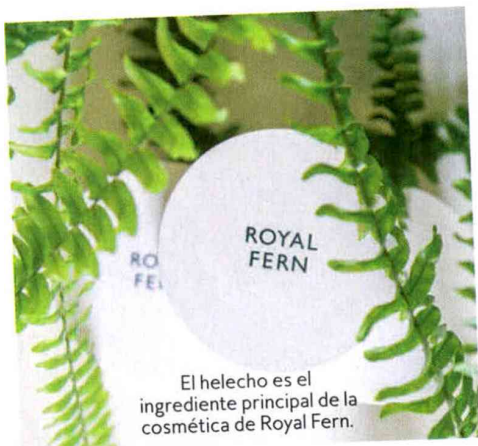
El helecho es el ingrediente principal de la cosmética de Royal Fern.

¿Sabías que el helecho es uno de los antioxidantes más fuertes y potentes de la naturaleza? "Es altamente resistente a la exposición a los rayos UV y a la contaminación urbana. Además, el extracto de helecho reduce los radicales libres, que son una de las razones de la pérdida de colágeno y, por tanto, del envejecimiento de la piel", declara Timm Golueke, dermatólogo y creador de la firma cosmética Royal Fern.