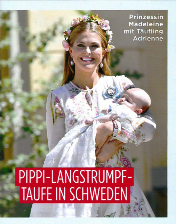
Prinzessin Madeleine mit Täufling Adrienne

über ihre Ehe, ihre Kinder und Familienurlaub in der Wildnis